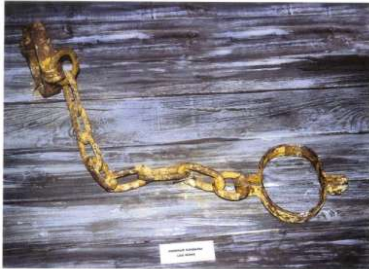
Figura 3 – Algemas de perna de Dostoievski