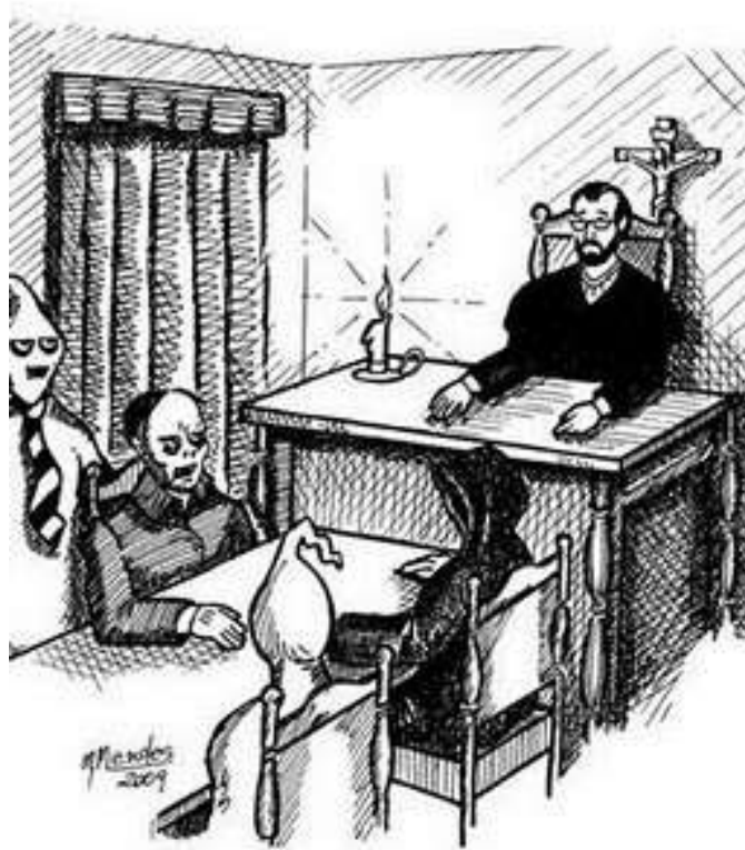
Figura 1 - Desenho de MMendes

Uma coisa levando a outra. Os textos vão vindo no imprevisto, como uma necessidade de contar e de contato e o melhor é que nós nos olhamos com delicadeza. Nós nos vemos na diferença e sabemos que é bom estar ali. Só isso. Bastante.